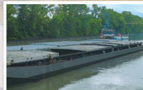
Transport per Schiff