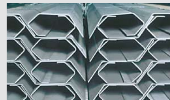
Hochfeste Bleche für den Kranbau