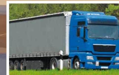
Transport per Lkw