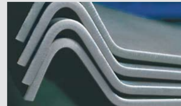
Hochfeste Bleche für den Brückenbau

Ein Werkszeugnis/Abnahmeprüfzeugnis gem. EN 10204/2.2 oder 3.1 kann ebenfalls zur Verfügung gestellt werden.