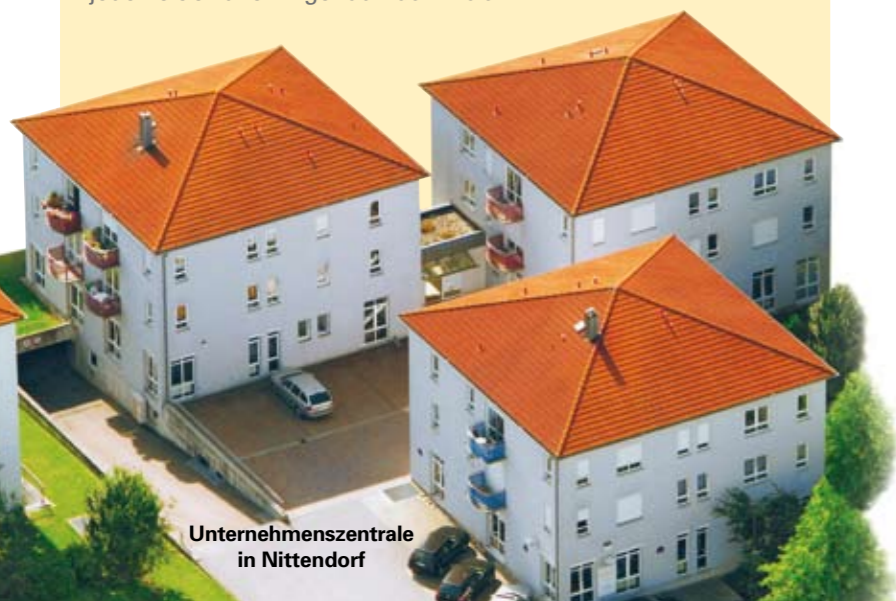
Unternehmenszentrale in Nittendorf

2008 haben wir mit unserer SLC Stahl Logistik Center GmbH in Wien eine Hochleistungs-Warmbandtafelanlage in Betrieb genommen. Mit dem umfassenden Lieferprogramm und den individuellen Logistikangeboten können wir Ihre Anforderungen jederzeit erfüllen – genau nach Maß.