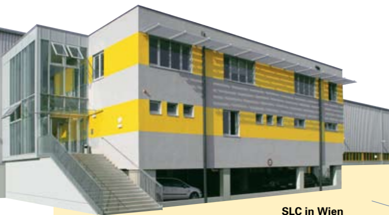
SLC in Wien

Im SLC Stahl Logistik Center stellen wir modernste Flachprodukte beginnend von einfachen Baustahlgütern bis hin zu hochfesten Stahlwerkstoffen her.