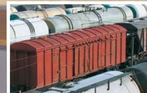
Transport per Bahn